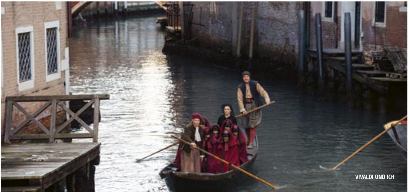
VIVALDI UND ICH