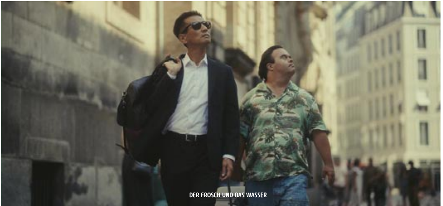
DER FROSCHE UND DAS WASSER